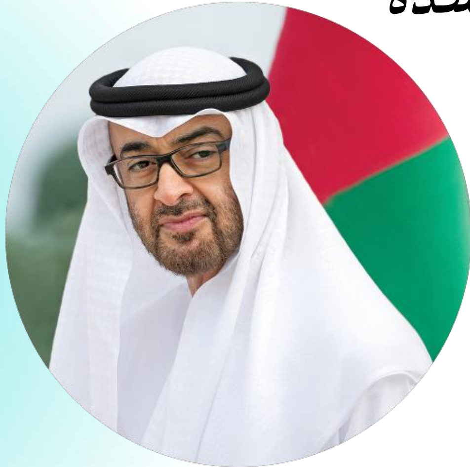
مقولة الشيخ محمد بن زايد رئيس دولة الإمارات العربية المتحدة

في الإنسان هو الاستثمار الحقيقي الذي ننشده